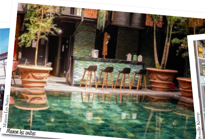
Manon les Suites