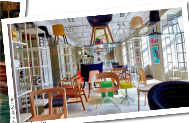
Musée du design