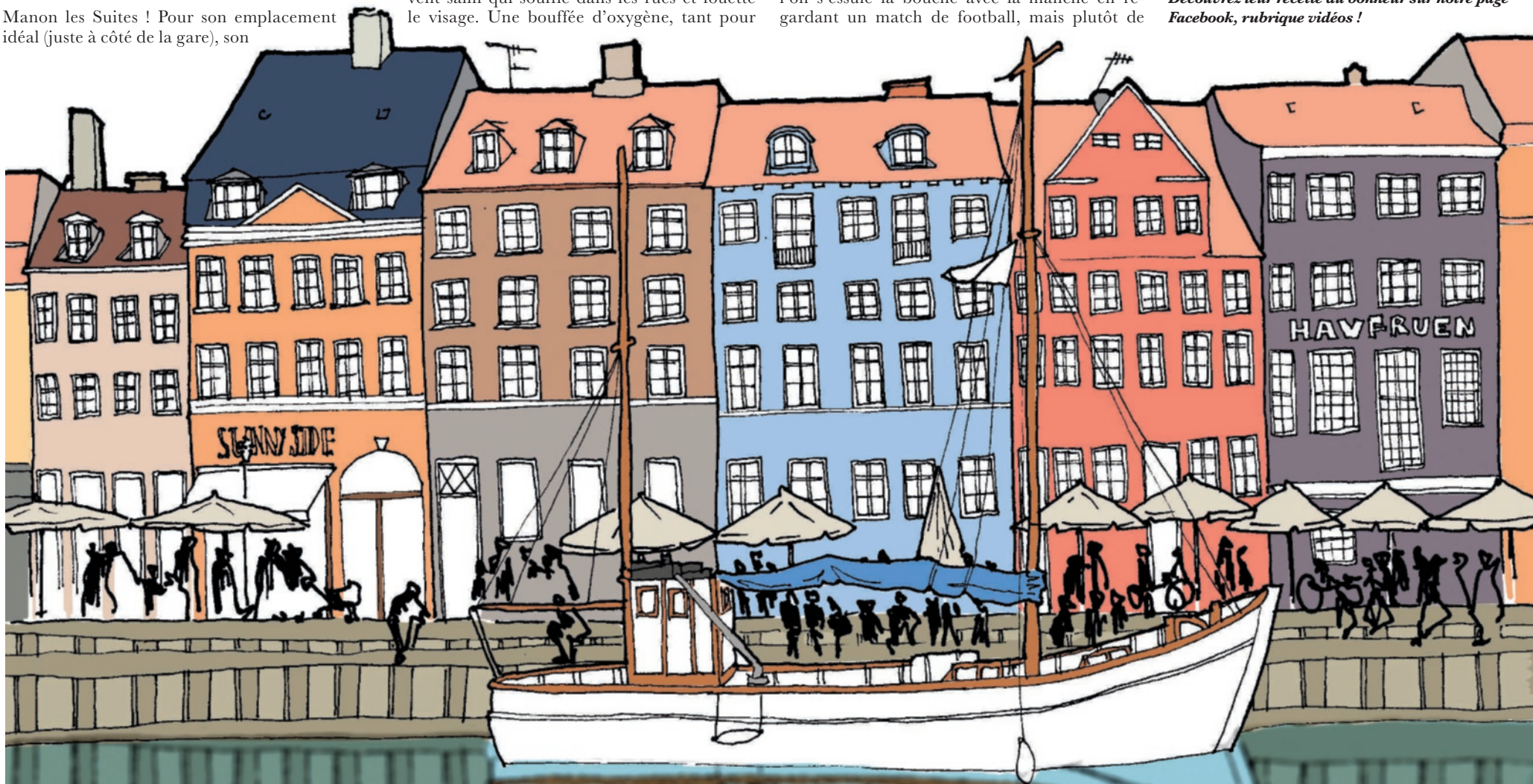
Illustration : Hélène Garçon

✉ Pourquoi les Danois sont-ils si heureux ? Découvrez leur recette du bonheur sur notre page Facebook, rubrique vidéos !