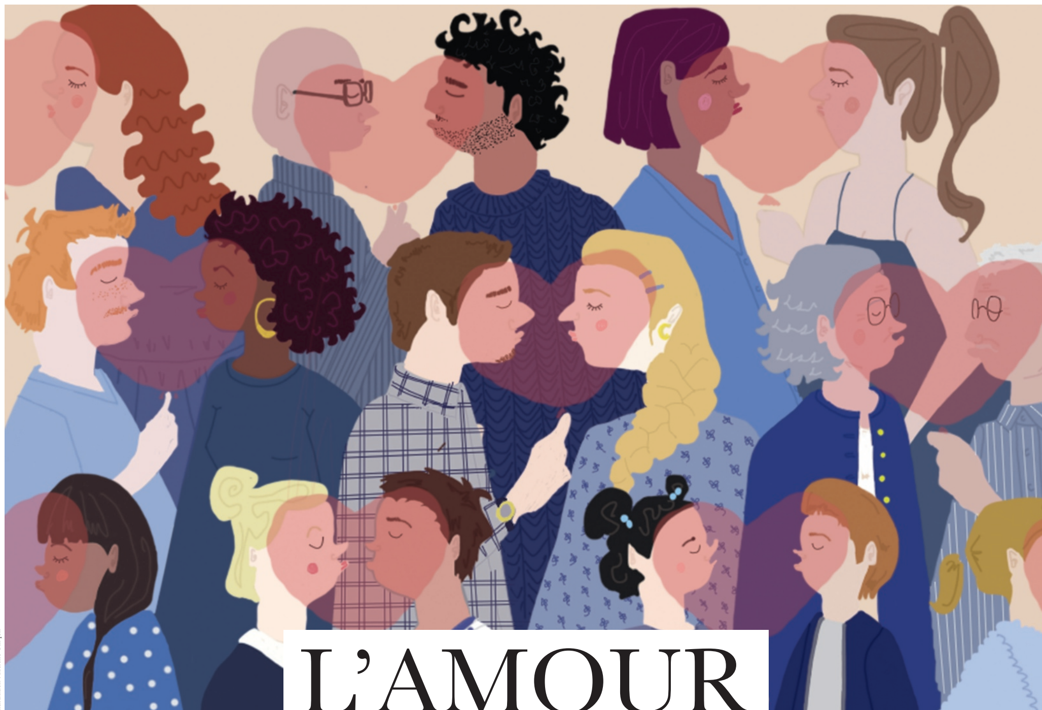
Illustration : Hélène Garçon